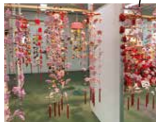
B棟5階 吊し雛&着付けサービス