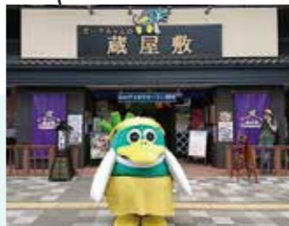
インフォメーション 謎解き雛めぐりお宝交換処