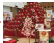
越谷ツインシティA棟2階

*無料着付けサービス(問合せ・予約 越谷市市民活動支援センター TEL: 048-969-2750)