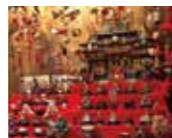
本のある蔵靴屋2階