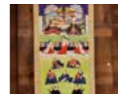
まち蔵Cafe油長内蔵2階