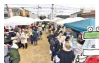
TEAMコアキナイ マルシェ&ステージ