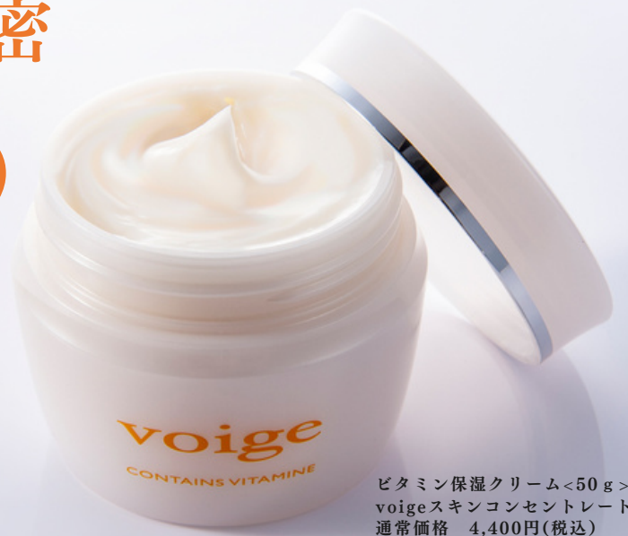
ビタミン保湿クリーム<50g> voigeスキンコンセントレート 通常価格 4,400円(税込)